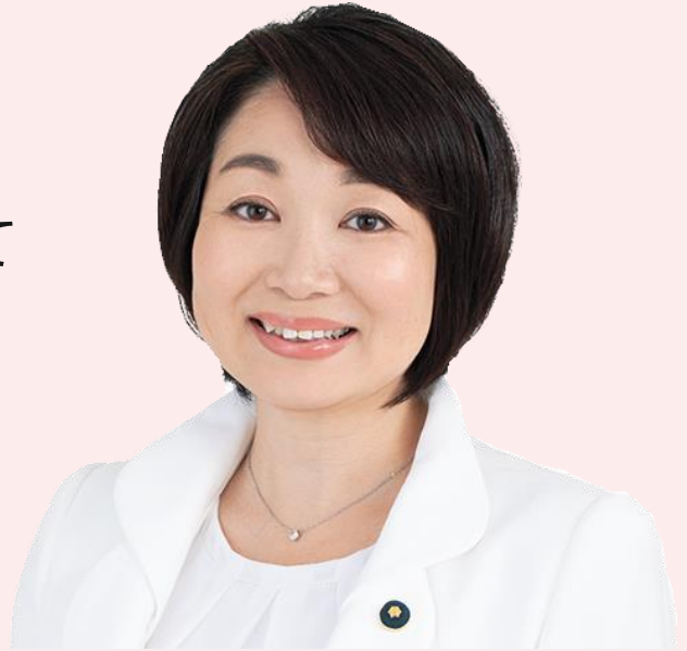
日本共産党東京都議会議員団