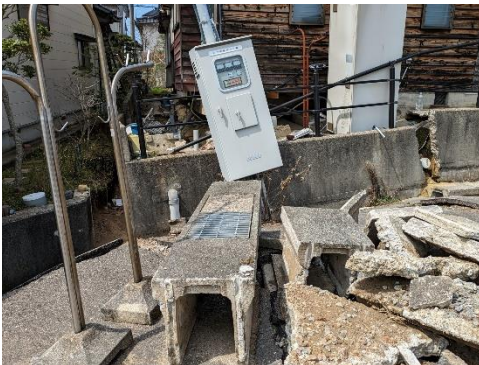
能登半島地震による被害の様子①

地震に強いまちづくりのためには、 耐震対策を自己責任とせず、行政の 責任で進めていく視点が重要です。 足立区では、都の新しい被害想定を