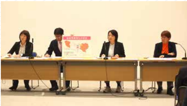
4党派共同で学校給食の無償化条例を提案（2023年12月記者会見）