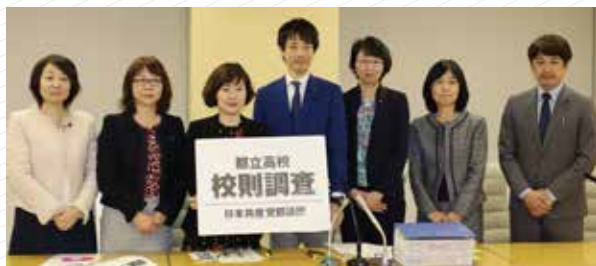
都立高校の校則調査を実施しました（2020年）

子どもの権利の視点から、都立高校の校則の問題について取り上げてきました。学校でも見直しが行われ、「ツーブロック禁止」「下着の色指定」などの校則は都立高校からなくなりました。また、校則を見直す際に、子どもの意見を聴くとしていなかったものが、意見を聴いて定めることが望ましいと変化しました（文科省「生徒指導提要」）。