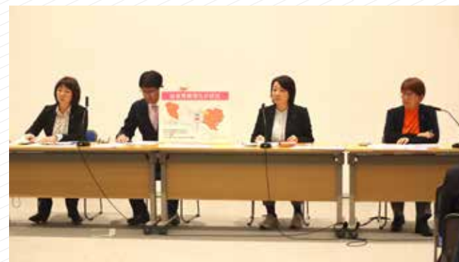
4会派共同で学校給食の無償化条例を提案 (2023年12月記者会見)