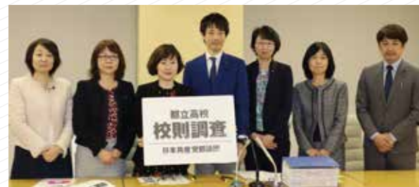
都立高校の校則調査を実施しました（2020年）

子どもの権利の視点から、都立高校の校則の問題について取り上げてきました。学校でも見直しが行われ、「ツーブロック禁止」「下着の色指定」などの校則は都立高校からなくなりました。また、校則を見直す際に、子どもの意見を聴くとしていなかったものが、意見を聴いて定めることが望ましいと変化しました（文科省「生徒指導提要」）。