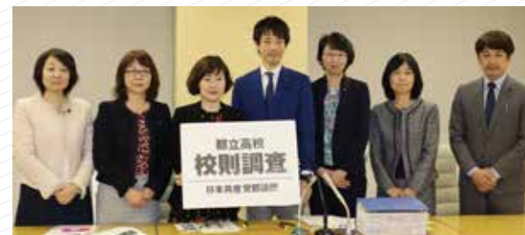
都立高校の校則調査を実施しました（2020年）

子どもの権利の視点から、都立高校の校則の問題について取り上げてきました。学校でも見直しが行われ、「ツーブロック禁止」「下着の色指定」などの校則は都立高校からなくなりました。また、校則を見直す際に、子どもの意見を聴くとしていなかったものが、意見を聴いて定めることが望ましいと変化しました（文科省「生徒指導提要」）。